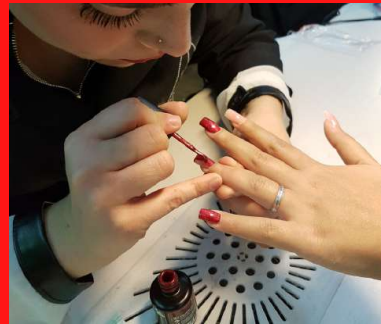
Lavori di Qualità